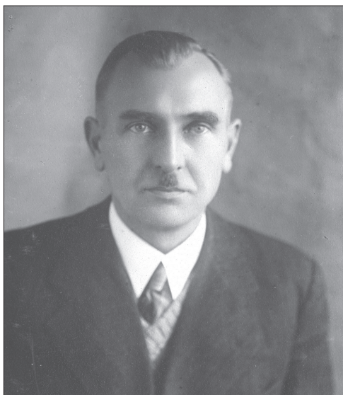
Po repatriacji do Gdańska, rok 1945

Zamieszkaliśmy początkowo na terenie obecnego Szpitala Psychiatrycznego Srebrzysko (niem. Silberhammer), praktycznie w jednym pokoju, bo nigdzie indziej nie było szyb. A zbliżała się zima! Do ogrzewania służyła nam tzw. „koza” z rurą wypuszczoną przez okno. Paliliśmy w tej kozie nie tylko drewnem, ale czym popadło. Miałem wówczas 10 lat i pamiętam, że pomagałem Mamie piłować i rąbać na opał powalone działaniami wojennymi brzozy w alei na terenie szpitala. Późną jesienią 1945 roku rozpocząłem naukę szkolną od IV klasy (tak wypadło według wieku) w Szkole nr 27 mieszczącej się obok cmentarza i Szpitala „Srebrzysko”.