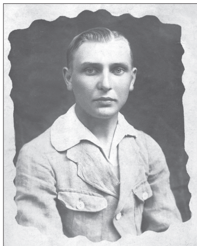
Jako gimnazjalista w roku 1921