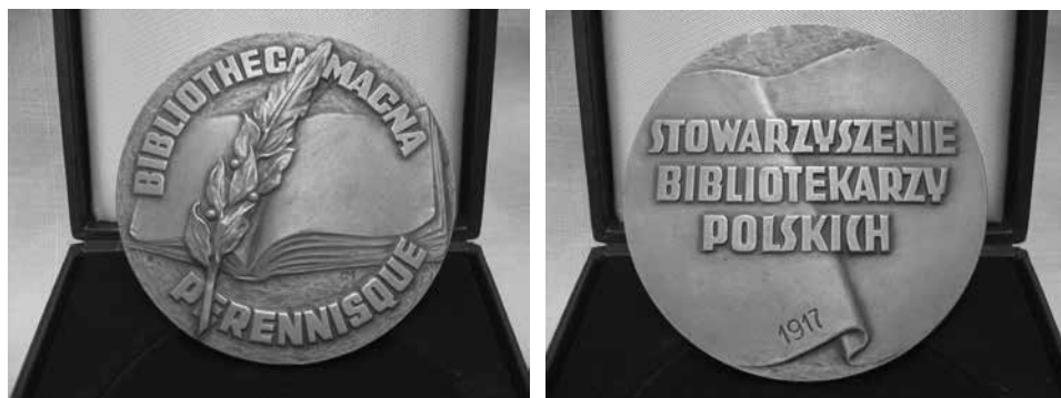
Ryc. 3. Medal „Bibliotheca Magna-Perrenisque” przyznany BG GUMed przez Stowarzyszenie Bibliotekarzy Polskich

Mimo wielu problemów Biblioteka funkcjonuje i dobrze wypełnia na co dzień swoje obowiązki jako system biblioteczno-informacyjny GUMed. W Bibliotece wykonuje się usługi