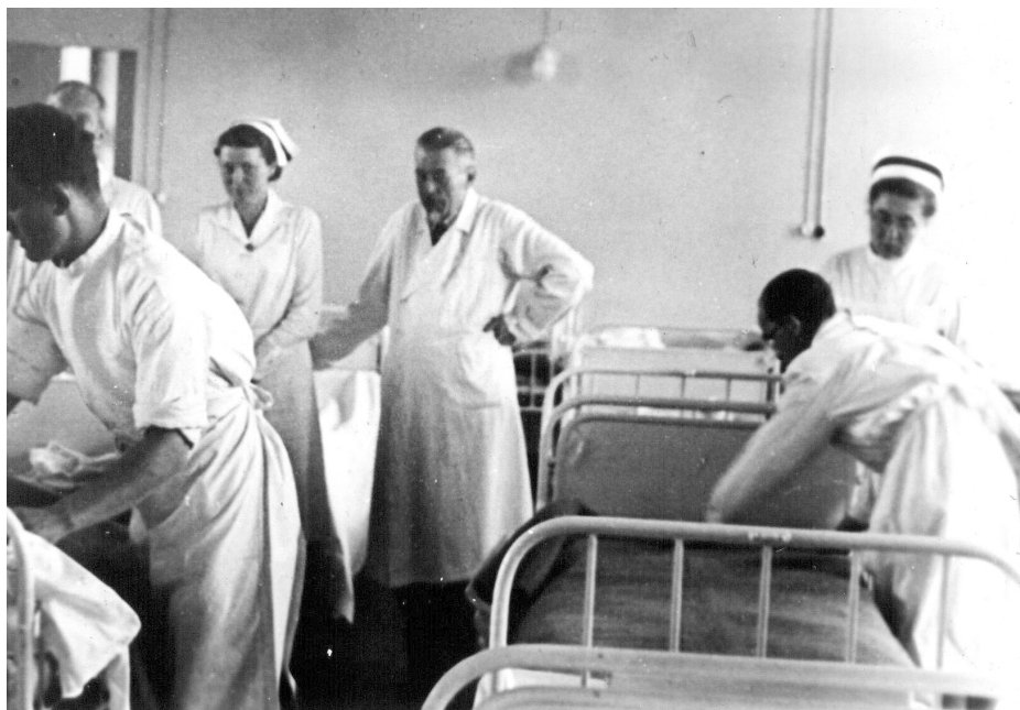
Ryc. 2. Profesor Kornel Michejda w czasie prac organizacyjnych w nowo powstałej klinice gdańskiej Fig. 2. The professor Kornel Michejda during preparation work in new established Gdańsk Department

Na mocy dekretu z 8 października 1945 roku w Gdańsku została utworzona Akademia Lekarska, a pierwszym chirurgiem powołanym na stanowisko profesora był Kornel Michejda. Kierownictwo kliniki objął 1 października 1945 roku. Profesor Kornel Michejda w ciągu kilku miesięcy zorganizował od podstaw Klinikę Chirurgiczną w dawnych budynkach nr 2 i 4,