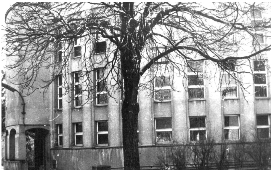
Ryc. 3. Sala wykładowa im. Ludwika Rydygiera