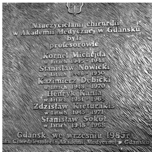
Ryc. 4. Tablica pamiątkowa znajdująca się w sali wykładowej im. Ludwika Rydygiera, upamiętniająca twórców chirurgii gdańskiej